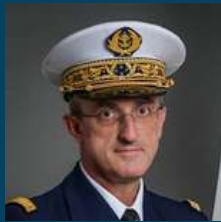
Amiral Nicolas Vaujour, chef d'état-major de la Marine française.